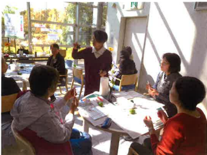
初めての方にも丁寧にわかりやすく教えて下さいました。