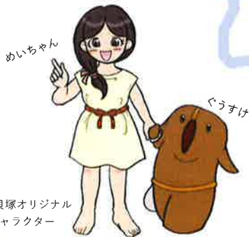
神明貝塚オリジナル キャラクター