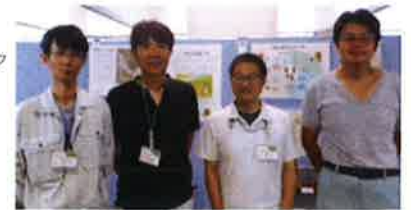
ご協力いただいた文化財保護課のみなさん

見どころは、神明貝塚のムラや縄文人の暮らしの様子を再現したジオラマです。長年の発掘調査や研究の成果から分かった春日部の縄文人の暮らしを、ぜひご覧ください。