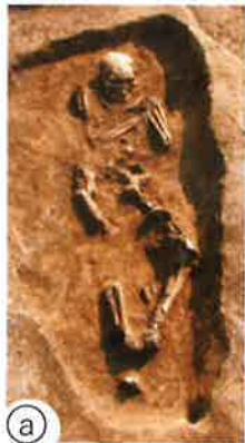
参考：春日部市役所HP、春日部市文化財保護課資料より